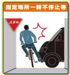
指定場所一時不停止等