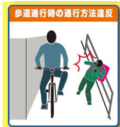
歩道通行時の通行方法違反