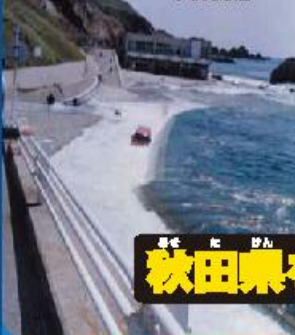
津波の被害 - 大津

1993年7月20日に 起きた巨大津波が 津波について、津波で はつなみによって18 人の犠牲者がで たことになりました。