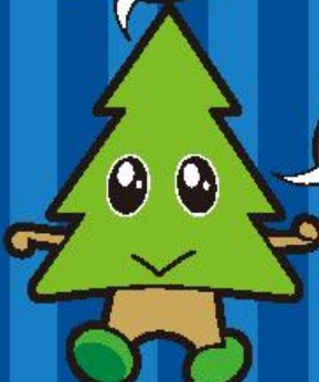
秋田県：秋田県庁、秋田県庁

「さいがいがおそく と、おそくするは どうし、おそくする おそくするとい ひます。」