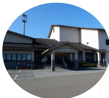
岩出山スコアハウス

* 鳴子に向かって47号線の信号機(ローソンあり)を左折し、すぐに仙台銀行を右折します。