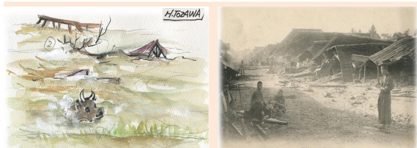
「荒雄川の堤防が切れて、田畑に水が入ったとや〜」とか、「川渡の橋が落ちて、橋げたが流されていったっけ」とかって、人々が騒ぎはじめ、赤い法被を着た消防の人たちが、慌ただしい動きを見せて、子ども心に恐ろしかったものでした。

主催 大崎市教育委員会 大崎市立岩出山小学校 日時 平成29年 1月19日(木) 13:30~16:30 会場 岩出山スコアハウス