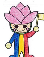
蓮池小安全キャラクター はーすちゃん