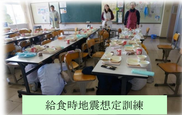
給食時地震想定訓練