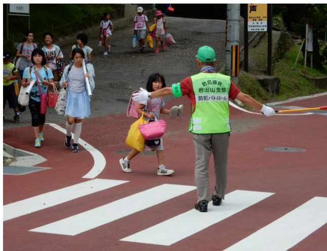
登下校時の見守り活動