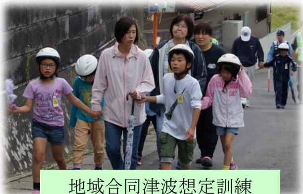
地域合同津波想定訓練