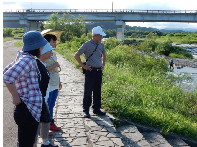
夏休みの地区巡視