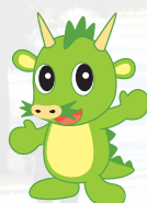
さいたま市PRキャラクター つなが竜